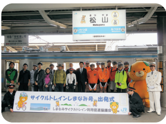
松山市・「サイクルトレインしまなみ号」出発式(4/19)