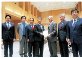
舛添要一 東京都知事に申入れ