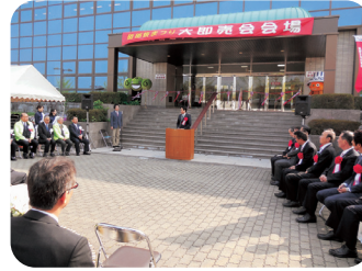
砥部町・第31回砥部焼まつり(4/19)