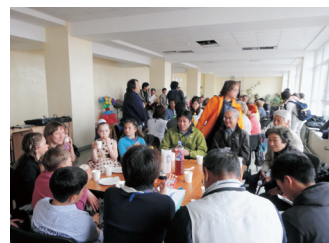
島に住むロシア人との意見交換会