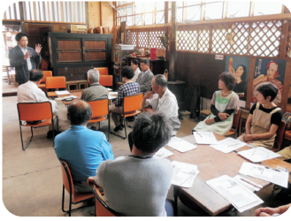
東温市・井内地区国政報告会(6/16)