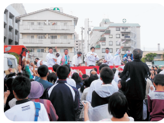
今治市・姫坂神社例大祭(5/11)