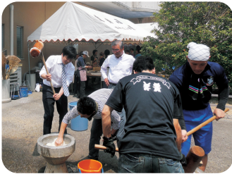
松山市・北条立岩ツツジまつり(5/3)