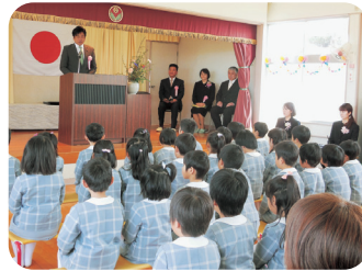
松前町・青葉幼稚園卒園式(3/21)