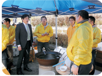
今治市・歌仙の滝まつり(3/21)