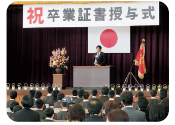
今治市・九和小学校卒業式(3/24)