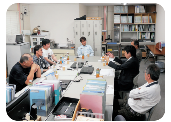
東温市・地域の方々とのミニ集会(5/17)