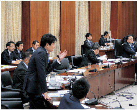
衆議院国土交通委員会にて質問(4/8)

1月に召集され、150日間に渡った通常国会も閉会しました。4月には消費税が8%に上がり、ようやく膨らみ続ける社会保障関係費に対して、十分と