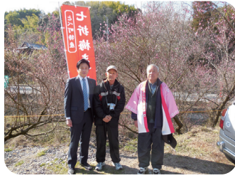
砥部町・七折梅まつり(2/22)