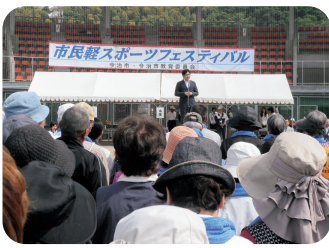
今治市・市民軽スポーツフェスティバル(5/18)