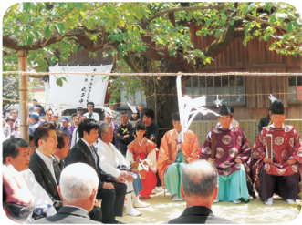
松山市・北条鹿島まつり(5/3)