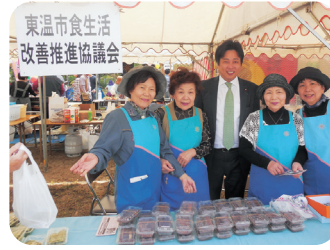
東温市・東温市商工会産業まつり(4/27)