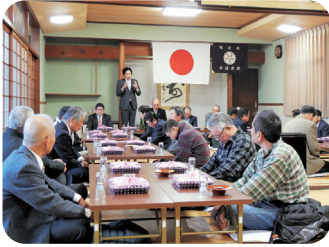
今治市・隊友会今治地区連合会新年会(2/9)