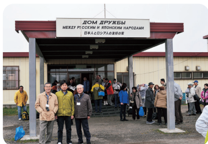
「日本人とロシア人の友好の家」で日本人元島民の方々と

クリル開発計画等により、国後島も道路や建物などのインフラ整備を通じたロシア化が進行している現状に対し、一刻も早い領土問題の解決へ向けて、政治の責任を痛感しました。