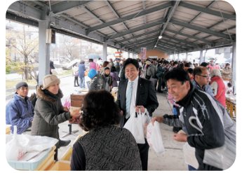
今治市・能島の花見とみやくほ浜マルシェ(4/13)