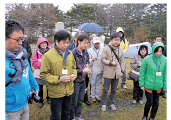
日本人墓地にて墓参り