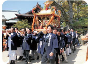
今治市・吹揚神社春の例大祭(5/10)